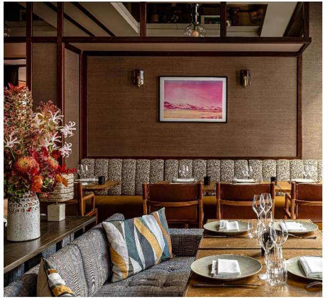
– French-Thai fusion restaurant with Chef Thiou –