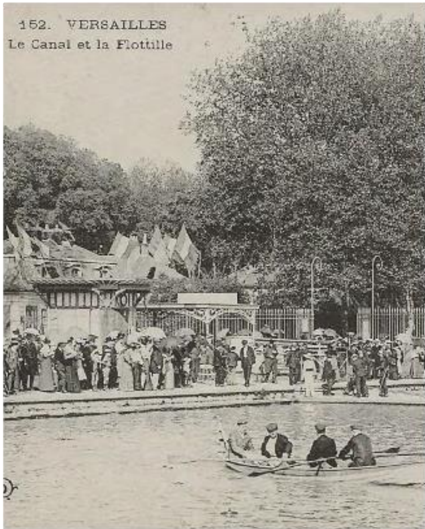
152. VERSAILLES Le Canal et la Flottille