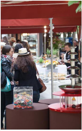
Fontaine de chocolat