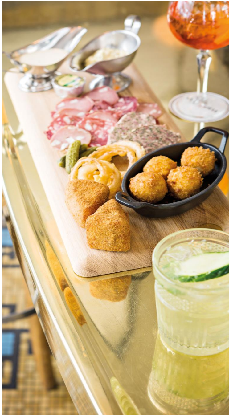
PLANCHE A PARTAGER