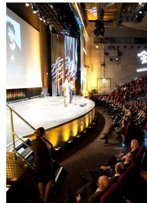
Amphithéâtre Gaston Berger