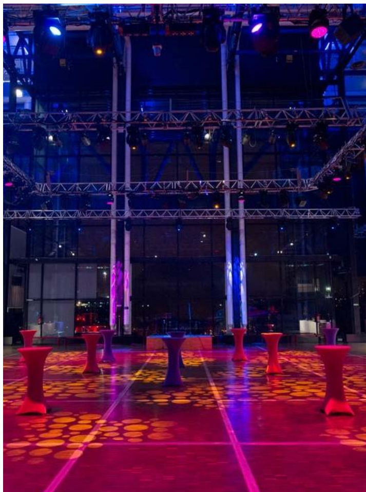
Cocktail sur Explora

Fort de son expérience reconnue, Bertrand restauration vous propose des offres clés en main répondant à vos attentes. D'une journée conférence, à une remise de prix ou une soirée de gala, nous adaptons à vos besoins et vous accompagnons dans chaque étape de votre manifestation.