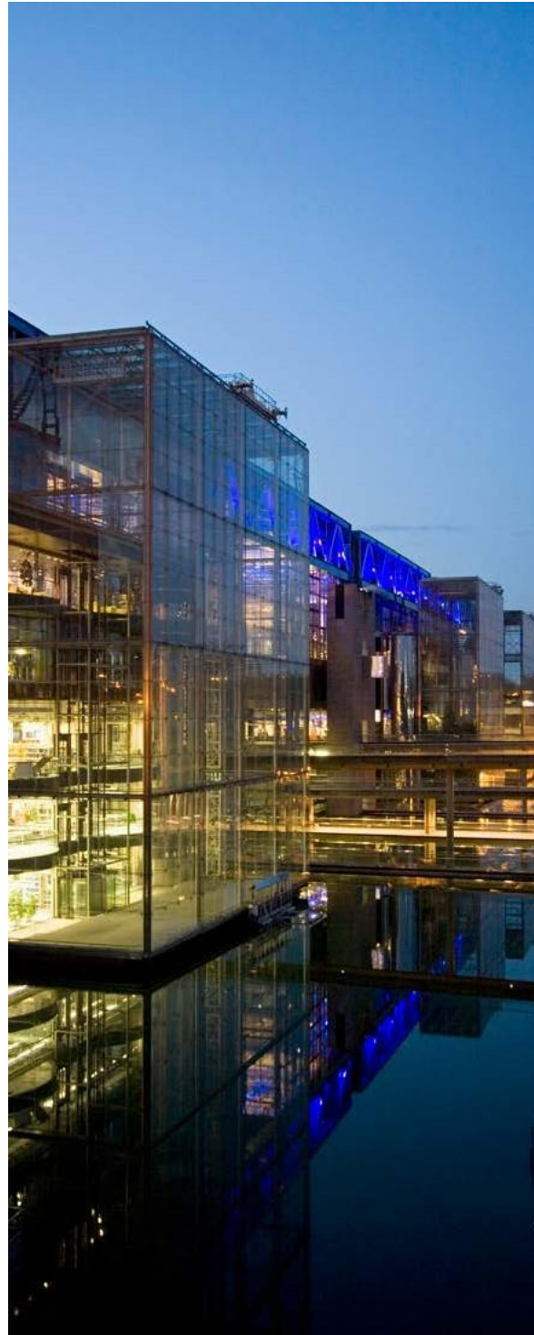
Cité des sciences de nuit