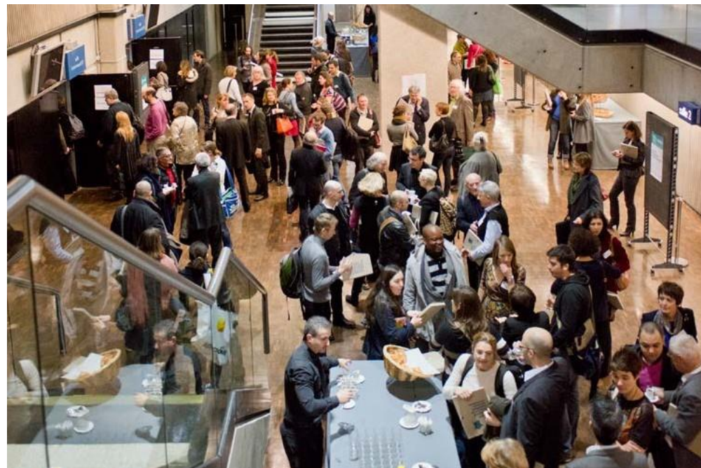
Foyers du Centre des congrès de la Villette