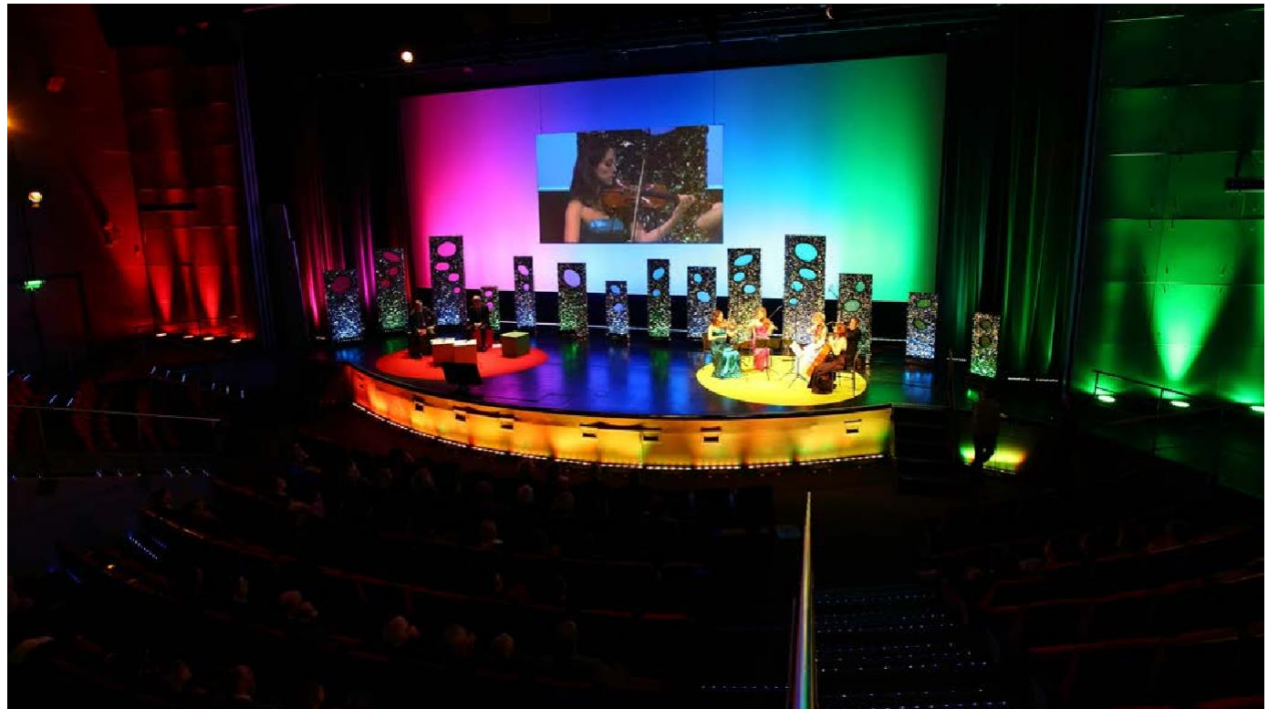
Amphithéâtre Gaston Berger