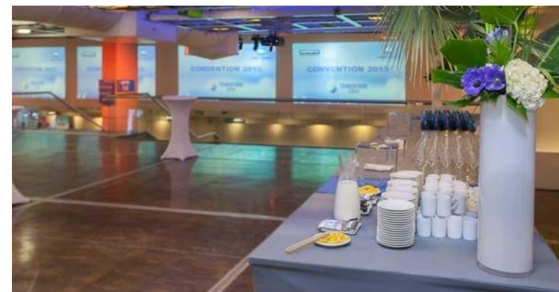
Le centre des congrès.