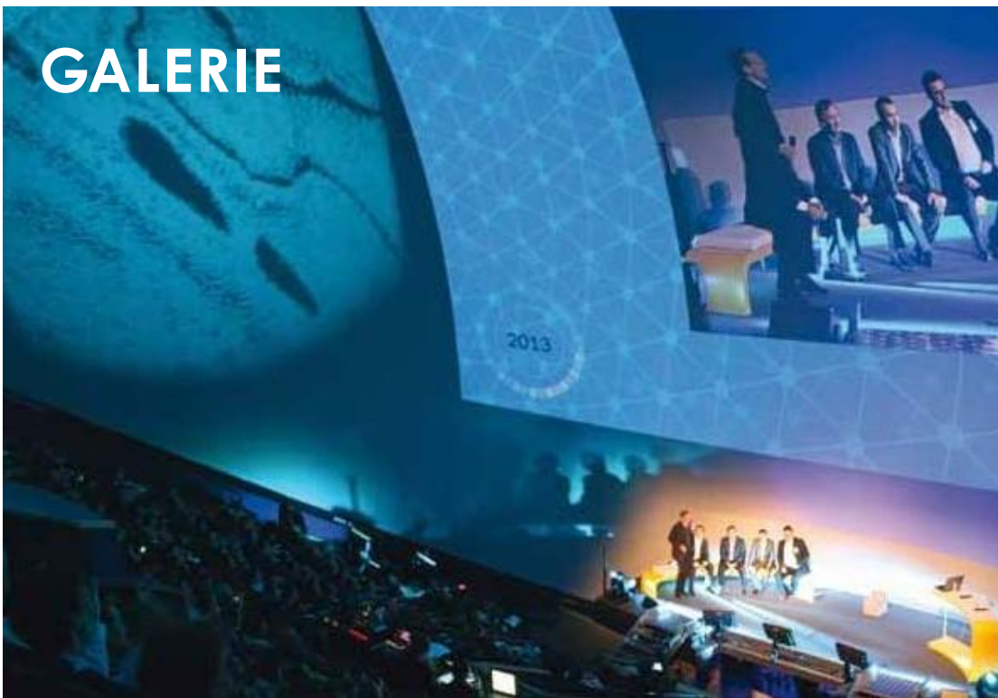
Amphithéâtre Gaston Berger