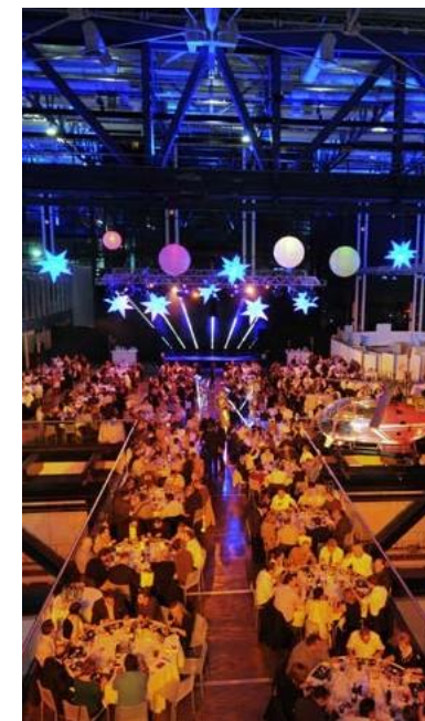
Dîner assis sur Explora