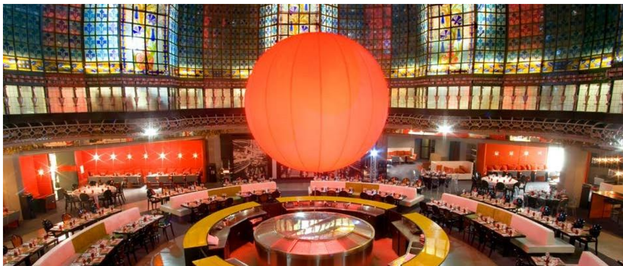
Printemps Haussmann - Brasserie Printemps