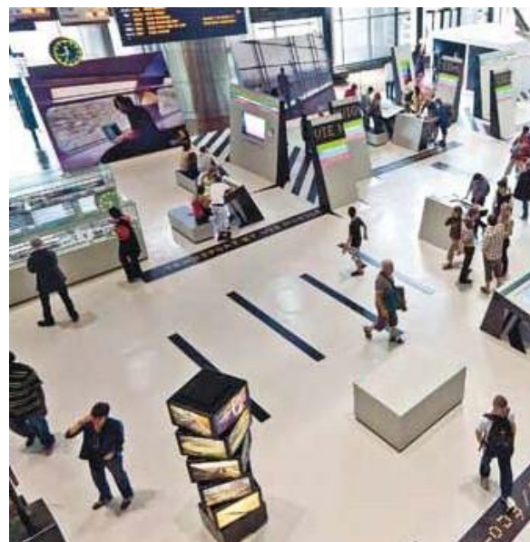
Expositions privatisables sur Explora