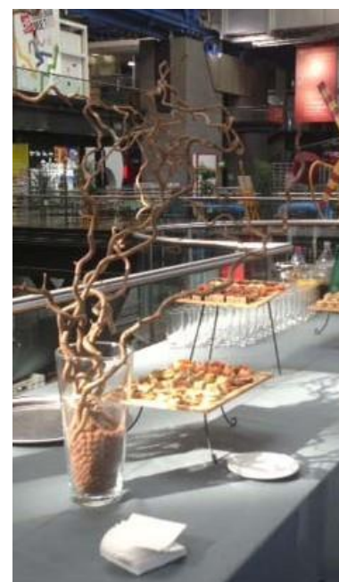
Cocktail Apéritif sur Explora