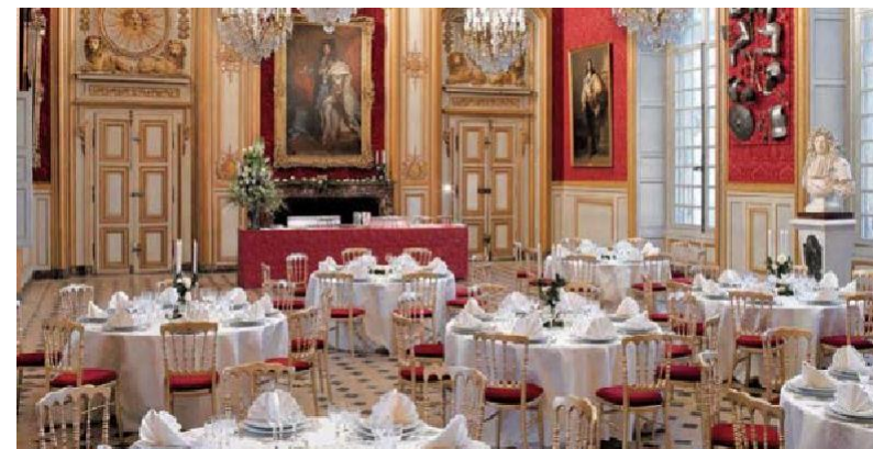
Musée de l'Armée - Grand Salon