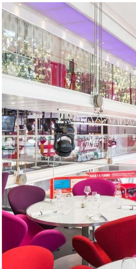
L'Atelier Renault - L'Atelier Renault Café

Aujourd'hui nous sommes présents dans des lieux culturels ou de loisirs prestigieux et avons à cœur de vous les faire découvrir au travers de privatisations événementielles. Bénéficiez d'une prestation sur-mesure dans des lieux uniques et originaux pour passer une expérience inoubliable !