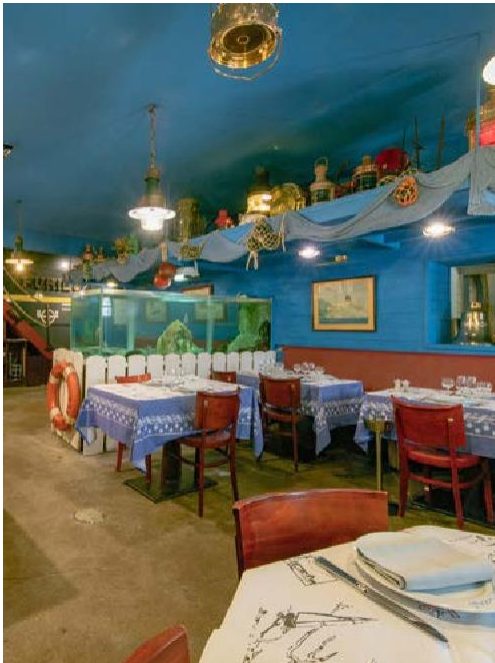
Salle de l'Aquarium