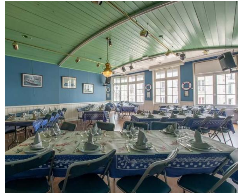
Passavant Banquet 1