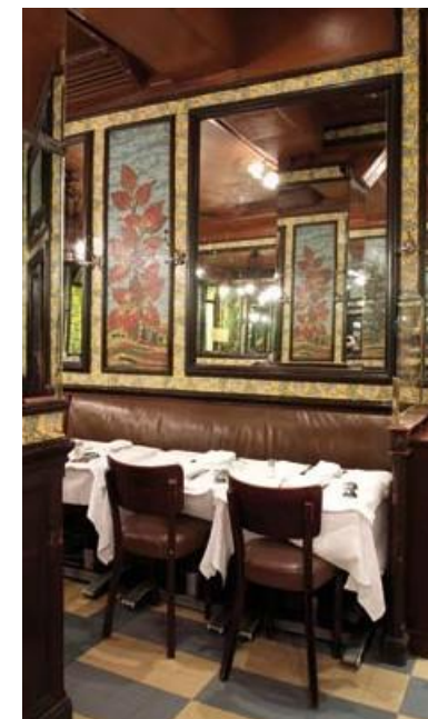
La salle du fond