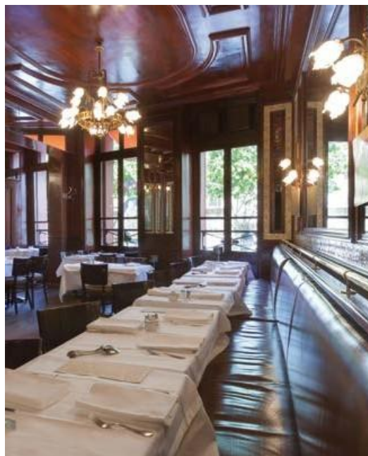
La 1 er étage

Au premier étage de l'institution parisienne qu'est la Brasserie LIPP, cet espace offre un cadre intemporel et élégant. Il peut accueillir jusqu'à 42 personnes en repas assis, pour vos déjeuners ou dîners.