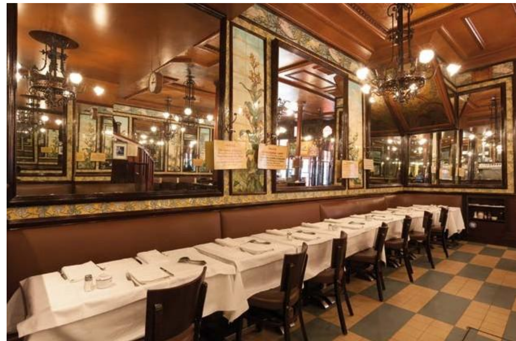
La salle principale