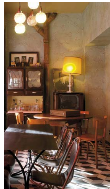
Le petit salon