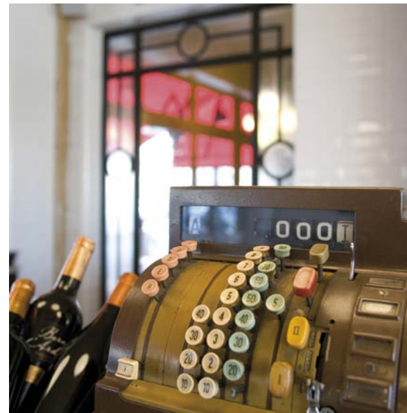
Authentique caisse enregistreuse