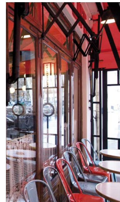
La terrasse Murat