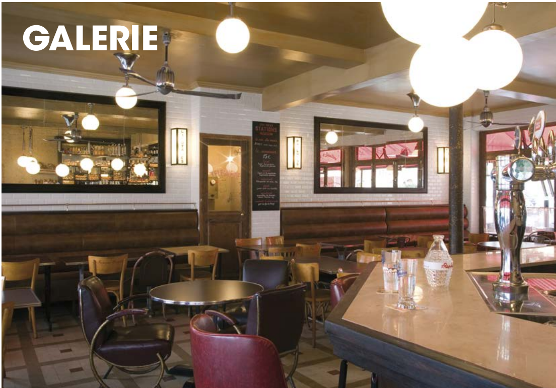
La grande salle